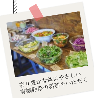
彩り豊かな体にやさしい 有機野菜の料理をいただく