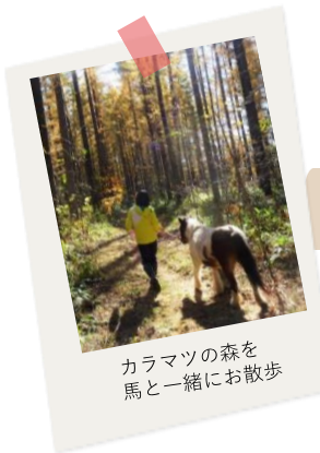
カラマツの森を 馬と一緒に散歩