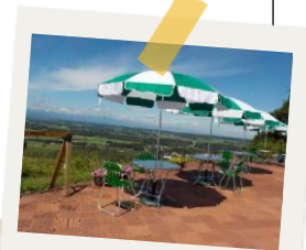
ゆっくり瞑想したり 生演奏を聞いたり...