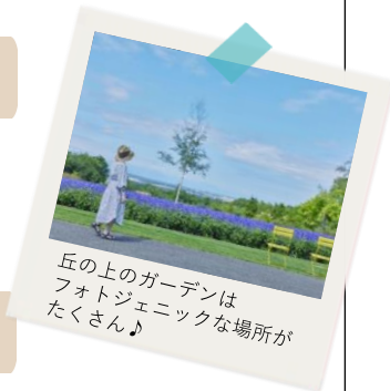
丘の上のガーデンは フォトジェニックな場所が たくさん♪